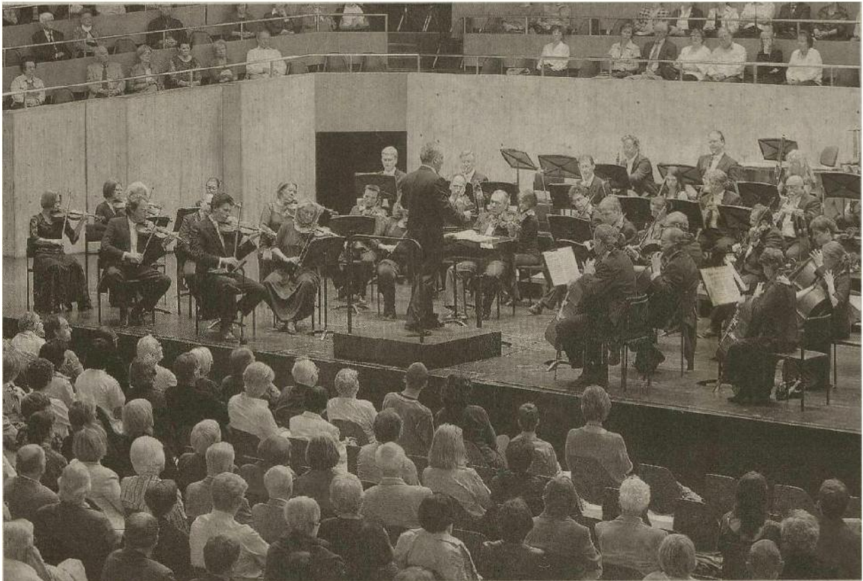
Zusammenlegung der Orchester machbar? Die Musiker des Sinfonieorchesters Biel verdienen weniger als ihre Kollegen in Bern.

In Bern wird über die Zusammenführung von Stadttheater und Berner Sinfonieorchester diskutiert. Der Alternativvorschlag eines gemeinsamen kantonalen Orchesters Biel und Bern gibt nun in Biel zu reden.